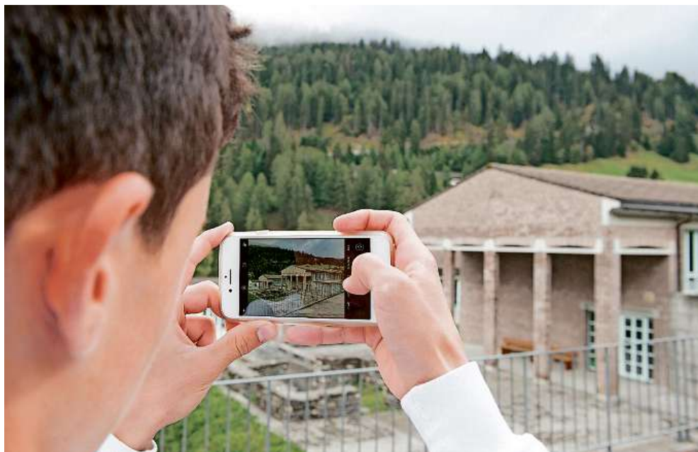
Auf der Suche nach dem richtigen Blickwinkel: Die Fotogruppe kommt am heutigen Öffnungstag der Riesen-Kugelbahn zum Einsatz.