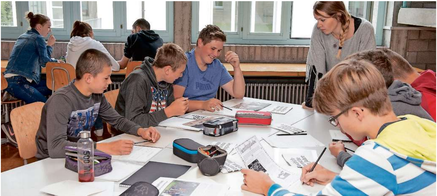
Was interessiert den Leser? Welche Fragen sind wichtig? Zu Beginn des Workshops werden Ideen gesammelt und aufgeschrieben.