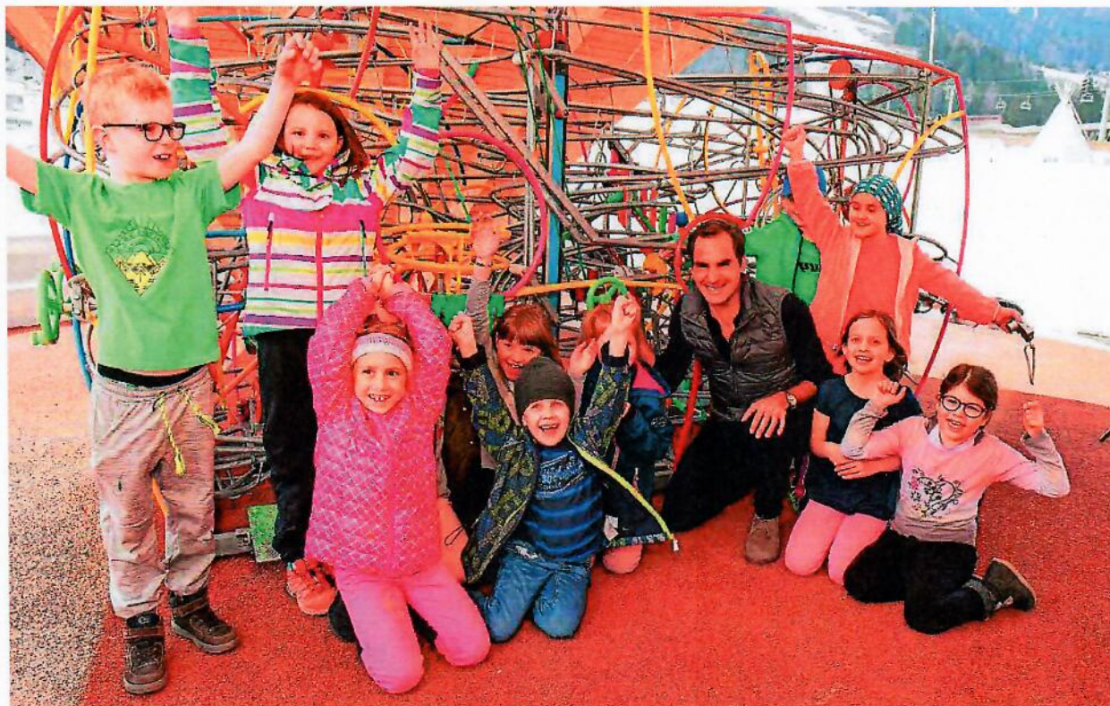
Der Jubel bei den Schülern war gross, als ihr Tennisidol vor ihnen stand und gemeinsam mit ihnen die Kugelbahn testete.